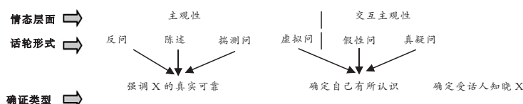
图2 “来着”表确证的形式和功能

着”。主观性是指说话人在说出一段话的同时表明自己对这段话的立场、态度和感情，从而在话语中留下自我的印记。 [24] 交互主观性是指言者用明确的语言形式表达对听者“自我”的关注。这种关注可以体现在认识意义上，即关注听者对命题内容的态度，但更多的是体现在社会意义上，即关注听者的面子或形象需要。 [25]124-139, [26] 我们发现，“来着”不仅表达说话人自我的立场态度，也可以表达对受话人的关注，一定程度上同时关涉主观性和交互主观性。当“X来着”采用陈述、反问、揣测问和虚拟问的时候，“来着”表“确证”呈现的是主观性层面的强调情态义；而当“X来着”采用假性问和真疑问的时候，以听者为取向，“来着”则是呈现交互主观性层面的强调情态义。如下图所示：